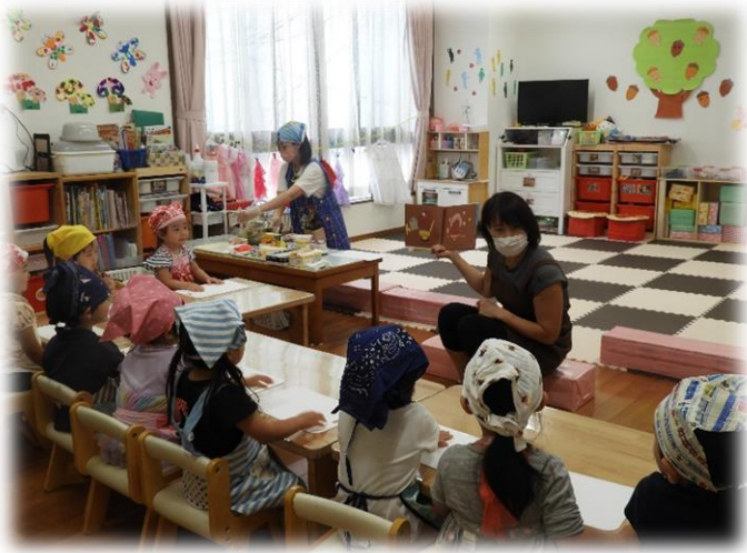
さつまのおいもの絵本を読んでもらいました！