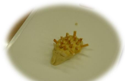
はいねずみの形にしていこう～♪