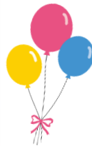
風船を使って 蹴ったり、投げたり、 キャッチしたよ♪