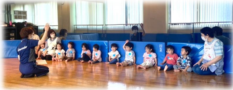
体操教室はじまり。お名前を呼ばれてお返事！