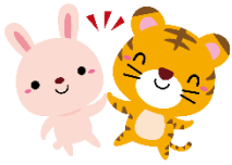
先生と ハイタッチ！