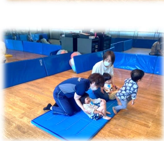
次はマットの上で、 お山座りから、ゴロ～ン