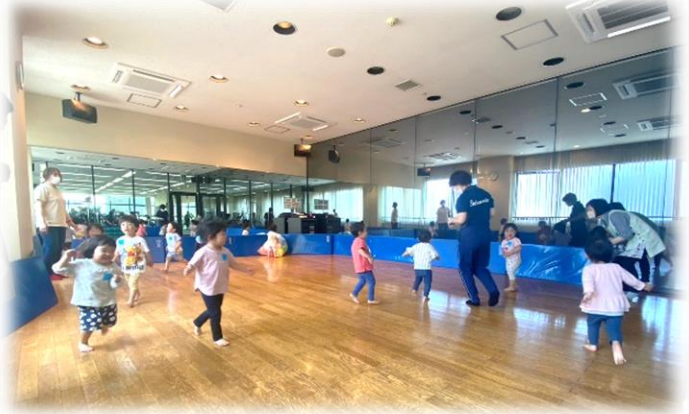
はじめは広いスタジオ内を散策☆